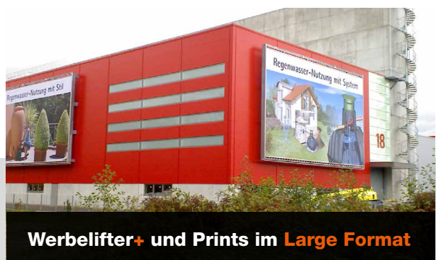
Werbelifter+ und Prints im Large Format