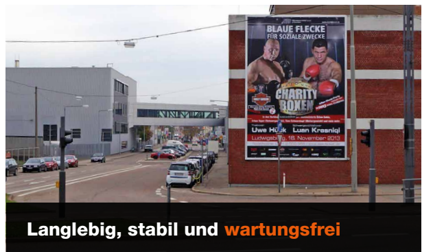
Langlebig, stabil und wartungsfrei