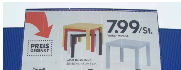
XXL-Lifter: Die großen für die Großen