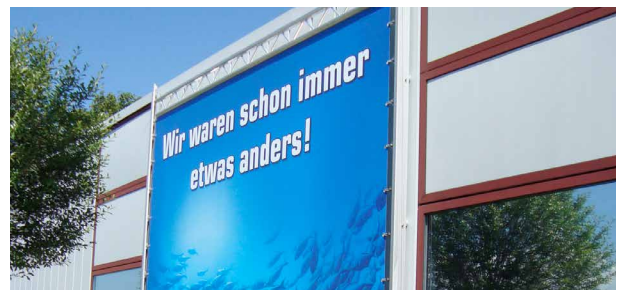
Schmal und hoch oder im Breitformat?