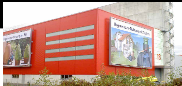
Werbelifter und Prints im Large Format