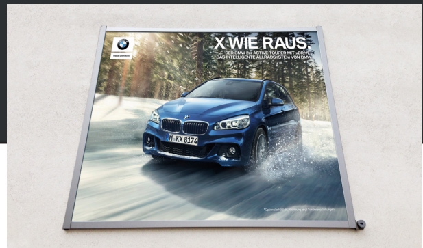
elegant mit individuellen Bannermaßen