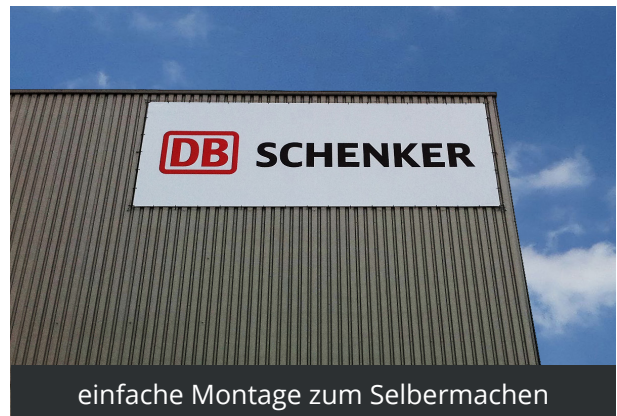
einfache Montage zum Selbermachen