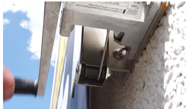
einfacher und schneller Bannerwechsel