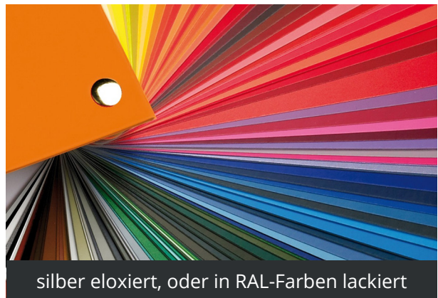
silber eloxiert, oder in RAL-Farben lackiert