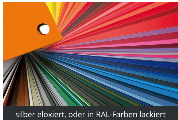
silber eloxiert, oder in RAL-Farben lackiert