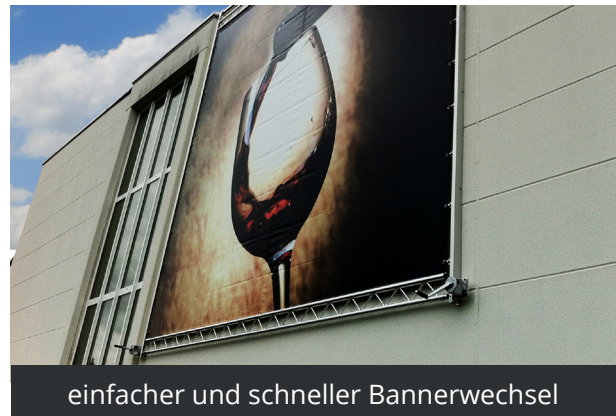
einfacher und schneller Bannerwechsel