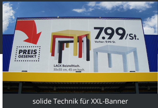
solide Technik für XXL-Banner